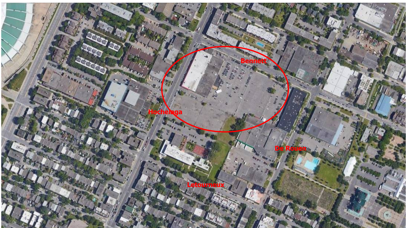
Figure 1 : Site approximatif du terrain visé par le projet

Faisant partie d'un territoire en pleine revitalisation, le site à l'étude s'inscrit à l'intérieur d'une planification détaillée du secteur Bennett-Letourneux amorcée par l'Arrondissement de Mercier-Hochelaga-Maisonneuve. Cette planification vise à faire du secteur un centre d'activités dans Hochelaga-Maisonneuve, soit un milieu de vie durable parsemé d'espaces verts, où l'on retrouve une offre de logements variée et de qualité soutenant une offre commerciale diversifiée et des activités d'emploi.