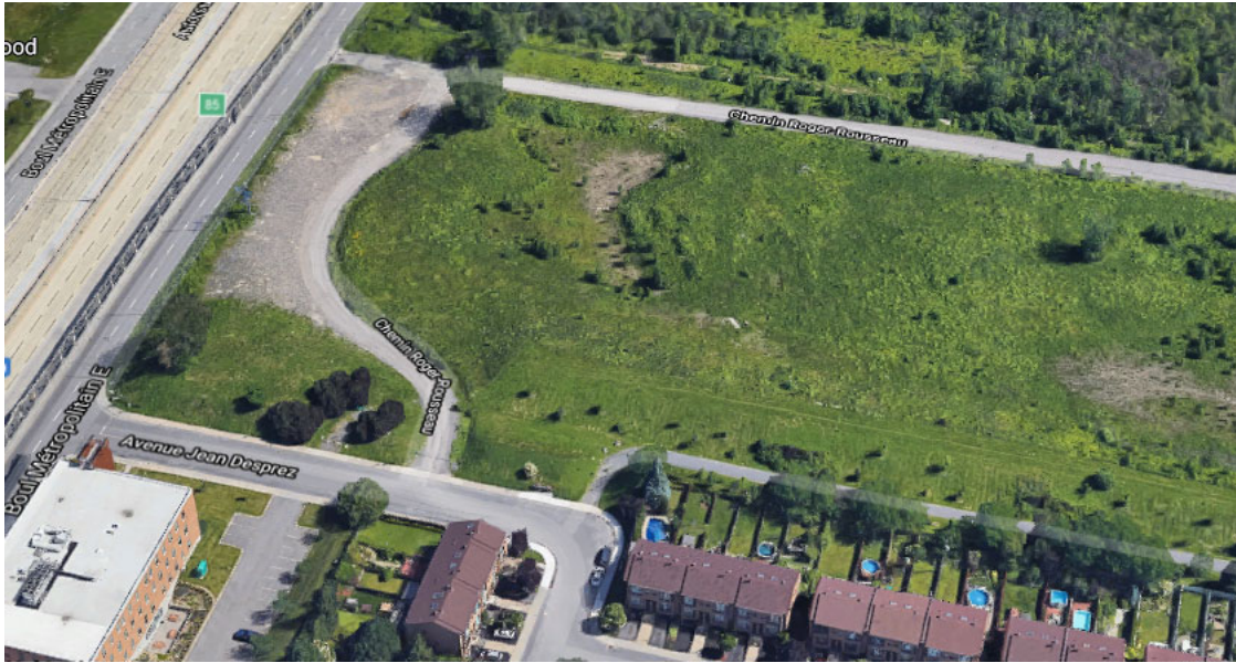
Territoire visé par la demande