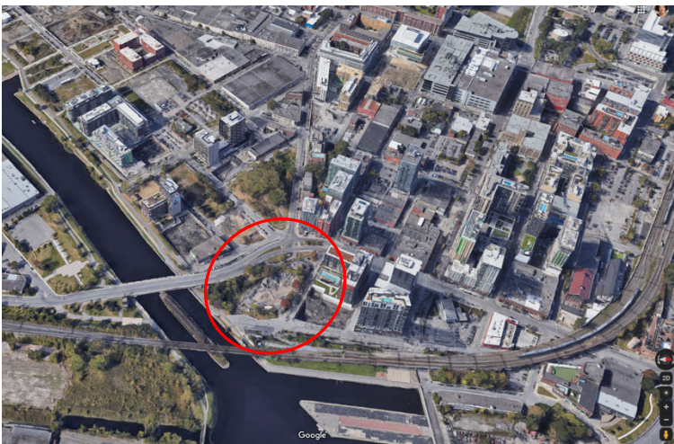
Zone approximative d'intervention

Le projet à l'étude concerne l'îlot situé dans la portion sud-est du PPU du secteur Griffintown, ceinturé par les rues Murray, Smith et Wellington, ainsi que les abords du canal de Lachine. Cet îlot comprend entre autres l'ancien Square Gallery, la promenade Smith ainsi que les lieux d'intérêt patrimonial suivants : la vespasienne, le tunnel Wellington (désaffecté) et la Tour Wellington (désaffectée).