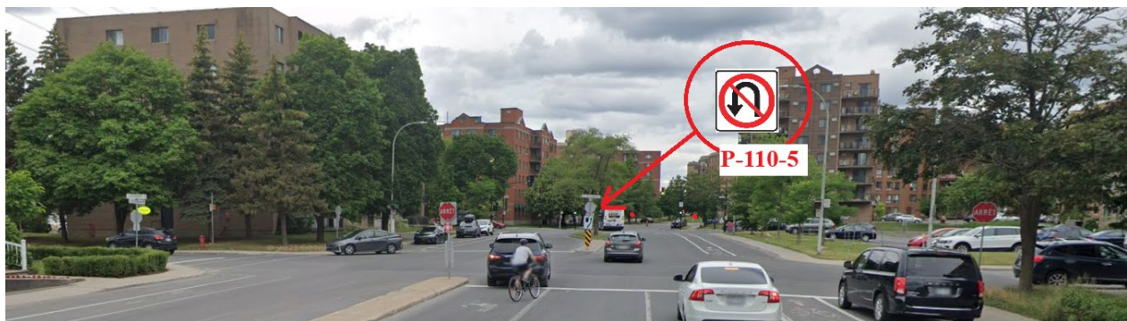
Boulevard des Galeries-d'Anjou direction sud à l'intersection de l'avenue de la Nantaise - Installer sur tige existante un panneau d'interdiction de demi-tour face vers le Nord