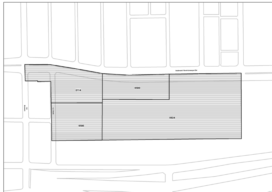
Localisation Dossier : 1234869006 Date : 4 décembre 2023 Zone(s) visée(s) Limite arrondissement de Ville-Marie

Ce projet particulier vise les zones ci-après illustrées :