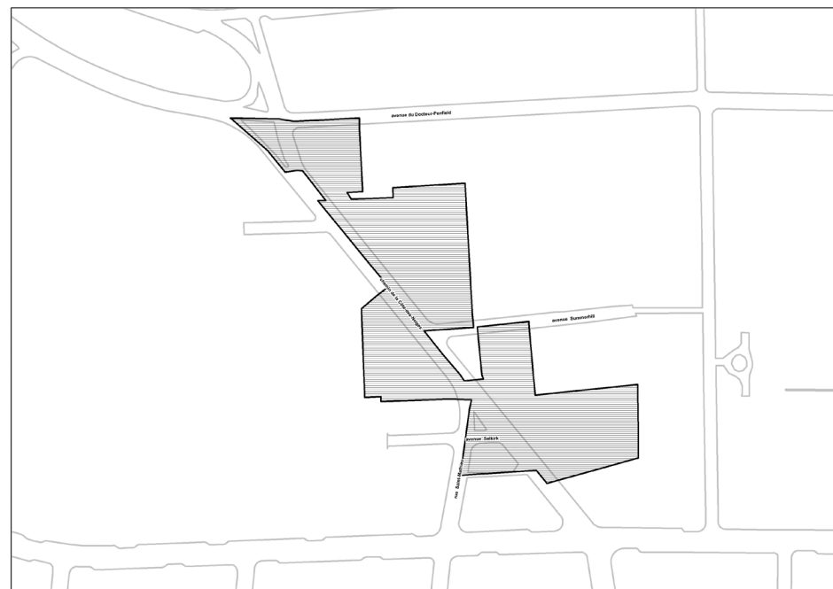
Localisation Dossier : 1234272002 Date : 4 décembre 2023 Zone(s) visée(s) Limite arrondissement de Ville-Marie

Ce projet particulier vise les zones ci-après illustrées :