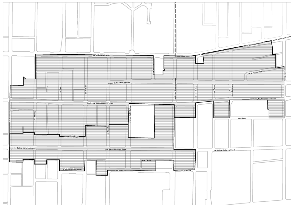
Localisation Dossier : 1237303005 Date : 4 décembre 2023 Zone(s) visée(s) Limite arrondissement de Ville-Marie

Ce projet particulier vise les zones ci-après illustrées :