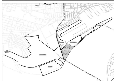
Localisation Dossier: 1207303003 partie 3 Date: 26 mai 2020 Zone(s) visée(s) Zones contiguës Limite arrondissement de Ville-Marie Montréal