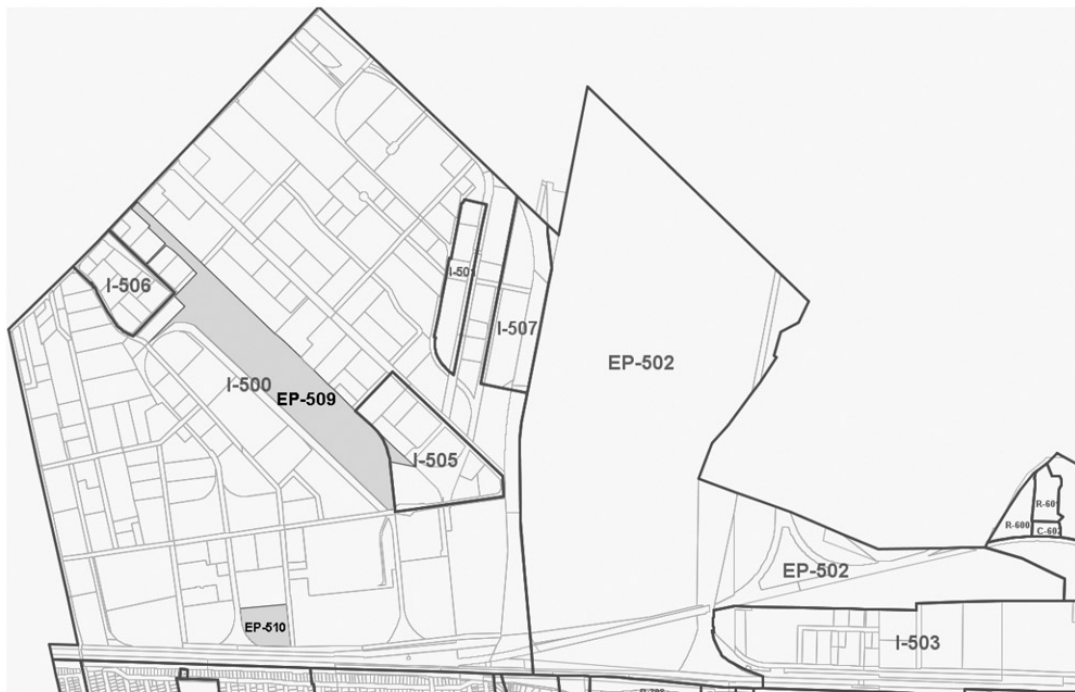
Carte 3 – Zones EP-509 (cour de triage Taschereau) et EP-510 (dépôt à neige 46° Avenue)