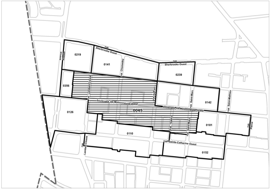
Localisation Dossier: 1187303004 Date: 12 mars 2018 Zone(s) visée(s) Zones contiguës Limite arrondissement de Ville-Marie Ville-Marie Montréal

c) Résolution autorisant la construction d'un bâtiment résidentiel de 5 étages et 15 mètres d'hauteur pour le bâtiment à construire au 99999, rue Saint-Marc, et ce, en dérogation notamment à l'article 9 du Règlement d'urbanisme de l'arrondissement de Ville-Marie (01-282) relatif, entre autres, à la hauteur maximale autorisée en mètres et en étages – pp 376 (dossier 1187303004) ; Ce projet particulier vise la zone et les zones contiguës ci-après illustrées :