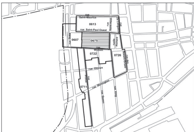
Procédure référendaire - plan des zones visées et contiguës Dossier: 1124400022 Date: 3 avril 2012 Zone(s) visée(s) Zones contiguës Limite de l'arrondissement Ville-Marie Montréal

Résolution autorisant l'aménagement d'un complexe immobilier mixte sur le lot vacant numéro 1 179 802 entre les rues Saint-Paul, Saint-Henri et William (Le site du Petit Séminaire), et ce, en dérogation aux articles 10, 61, 70 et 230 du Règlement d'urbanisme de l'arrondissement de Ville-Marie (01-282) relatifs, entre autres, à la hauteur maximale, à l'alignement de construction et aux usages prescrits (dossier 1124400022);